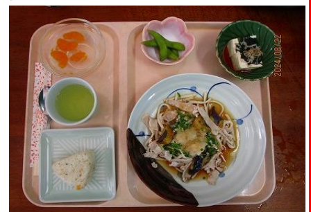
生姜香る冷んやりなすおろしうどん