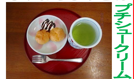
プチシュークリーム