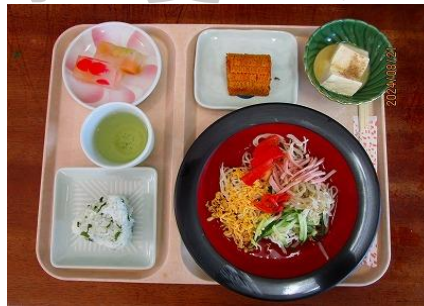
これぞ夏の定番ふる里冷やし中華