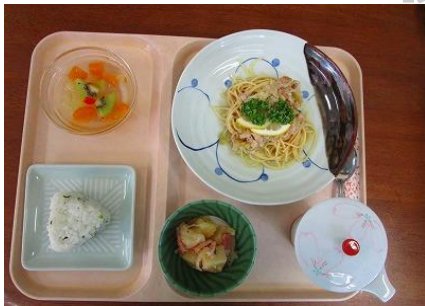
さっぱり鶏塩レモンの冷製スパゲッティ