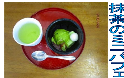
抹茶のミニパフェ